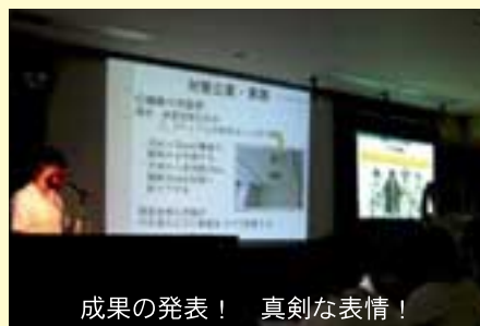
成果の発表！ 真剣な表情！

審査委員の厳正な審査のもと、今年度の発表会の受賞チームを決定しました。主な結果は次のとおりでした。