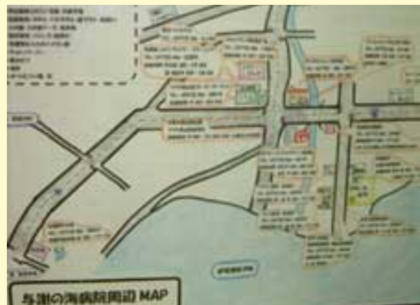
(最優秀賞) 病院周辺の手作りマップ