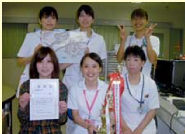
株まっぷっぷメンバーの喜びの表情