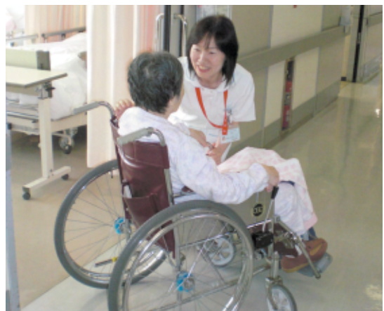
14:00 患者さまのラウンドの様子