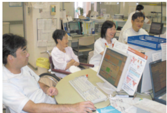
11:35 ナースステーションにて