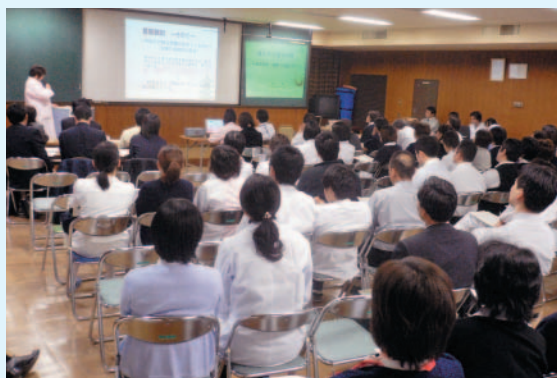
QCサークル活動成果発表会（12月6日）

※QCサークルとは一般に仕事の改善を自主的に行う小グループ活動を意味しています。当院では経営改善と患者様へのサービス向上を図るために、多くの有志職員が取り組んでいます。