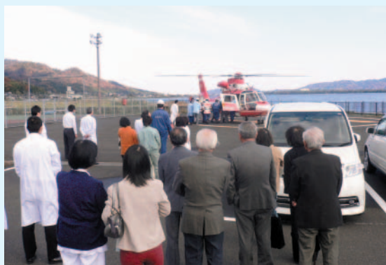
第2回病院モニター（12月6日）ではヘリコプターによる緊急搬送を見学していただきました。

※QCサークルとは一般に仕事の改善を自主的に行う小グループ活動を意味しています。当院では経営改善と患者様へのサービス向上を図るために、多くの有志職員が取り組んでいます。