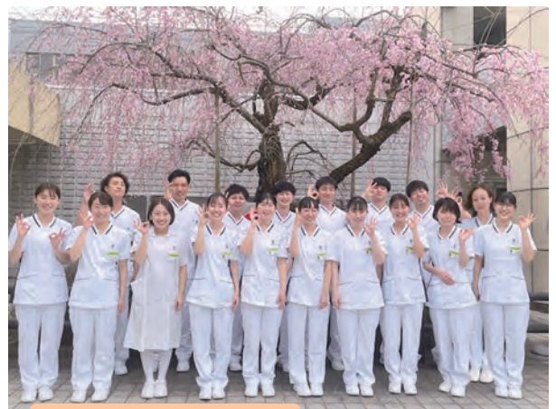
令和6年度 新規入職者