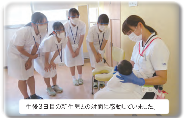
生後3日目の新生児との対面に感動していました。

今回参加された生徒さんの中には、管理栄養士、放射線技師、看護師、医師、助産師を目指す方がおられました。