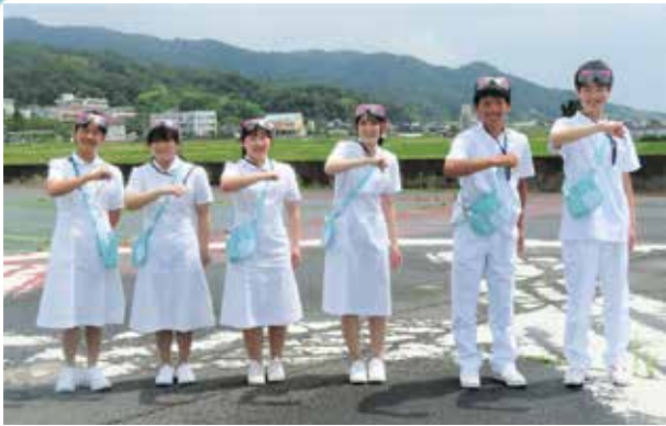
ヘリポートの前でハイポーズ

体験学習を終えた生徒さんは眼を輝かせ「将来、医療者として頑張りたいです」と発表され、私達は感動しました。いつか、職場体験学習に来ていただいた皆さんと一緒に働ける日を楽しみにお待ちしております。