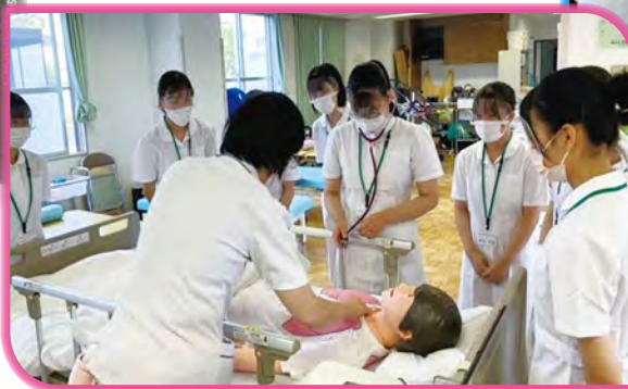
近隣高校の参加によるふれあい看護体験