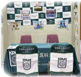
北部地域看護職就職・就学フェスタ(舞鶴市)

丹後地域で看護師を目指す学生さんや、資格を持ち就業を考えておられる方には、病院見学等も随時受入れておりますのでお気軽にお問い合わせください。