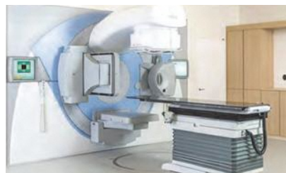
リニアック（放射線治療）装置