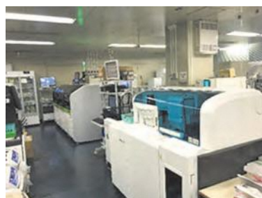
検体検査の分析機器

の方針を決める大きな手助けにもなり、治療経過の確認、重症度の判定や回復の度合いなどにも利用され、現代医療に欠かすことのできない存在です。検査についてご不明な点等ございましたらお気軽にお問い合わせください。