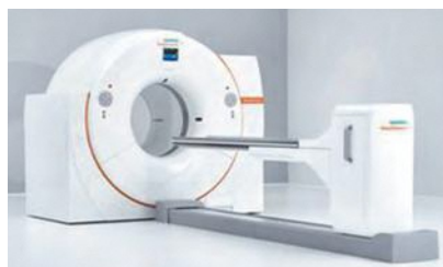
PET-CT（陽電子放出断層撮影）装置