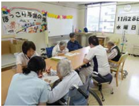
ほっこりでの風景

平成29年度の利用者は延べ1150名でした。サービス内容は、音楽歌唱・切り絵・ゲーム・体操等のレクリエーションです。患者さんからは「楽しい」「手や肩の具合がよくなった」、ご家族からは「面会に来た時の表情が変わりました」とうれしいお言葉をいただいています。看護師は、「ほっこりでのことをよく話されます」「夜の睡眠時間が長くなりました」等ディサービスの効果を実感しています。これからも患者さんがいきいきと過ごせるようなケアの提供を心掛けます。