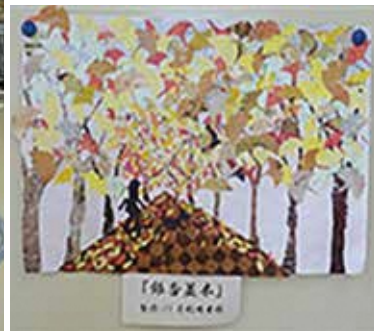
患者のみなさんと作った作品